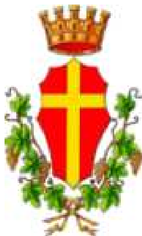
Città di Messina